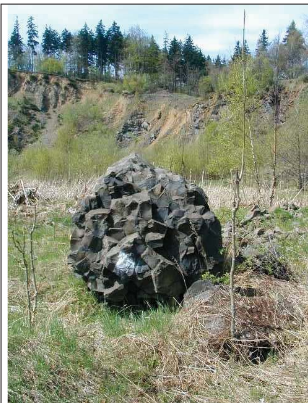
Foto č. 1: Lom Polevsko - celkový pohled s balvanem čedičové horniny se špatnou sloupcovitou odlučností v popředí