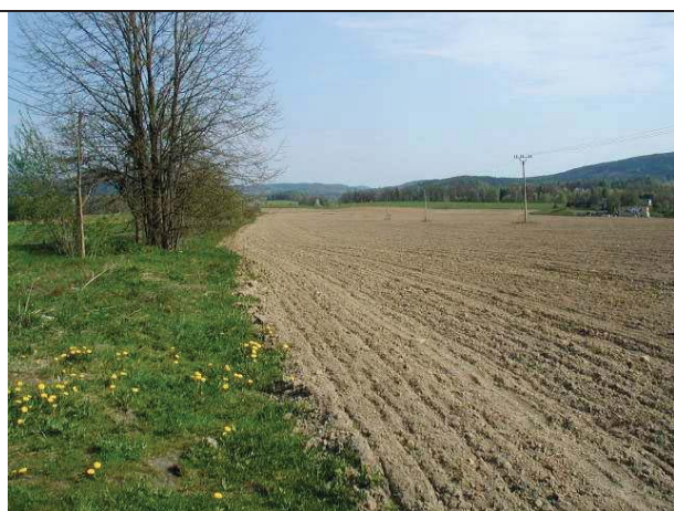
Foto č.....: Jablonné v Podještědí - celkové foto severovýchodní část ložiska