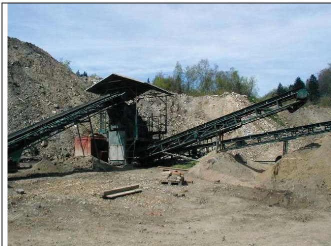
Foto č. 5: Lom Polevsko – skládka stavebních sutí ve vytěžené části lomu s linkou na úpravu sutí