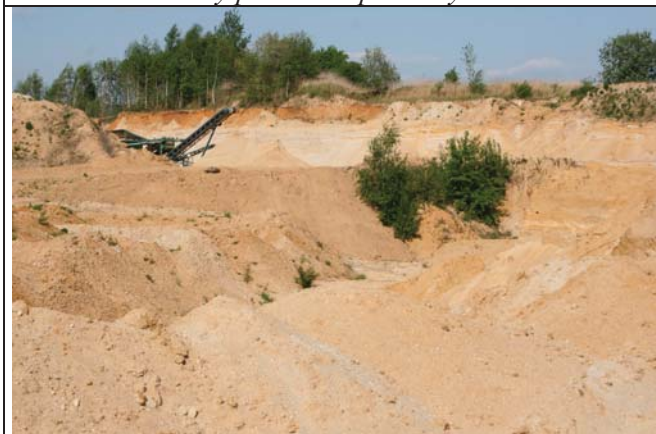
Foto č. 3: Situace na dně pískovny, v pozadí s technologickým zařízením