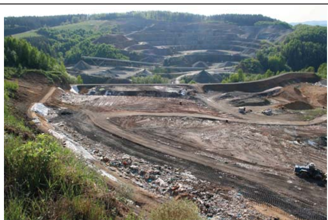
Foto č. 2: Celkový pohled na lom s rekultivací vytěženého prostoru zavázkou v popředí