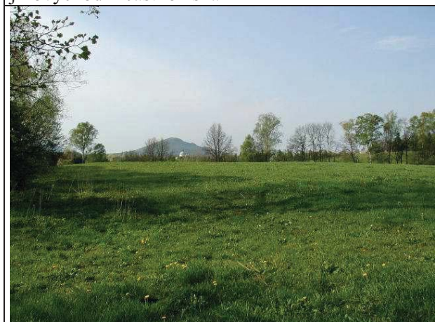
Foto č.....: Jablonné v Podještědí - celkové foto jihozápadní část ložiska