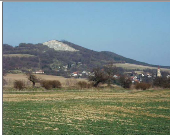
Foto č. 3: Maršovický vrch (ložisko Újezd u České Lípy) – náhrada ložiska Tachov?