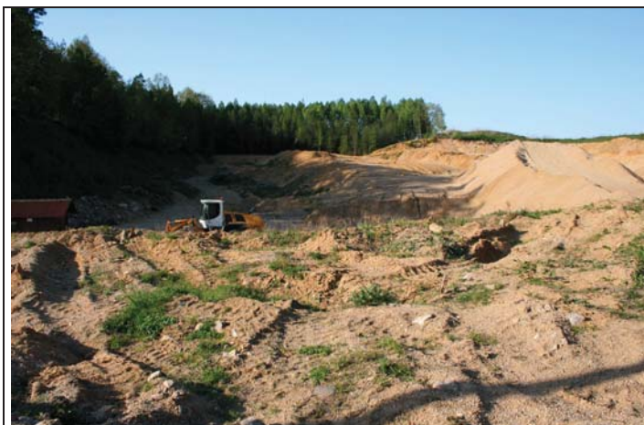
Foto č. 1: Celkový pohled na těžebnu