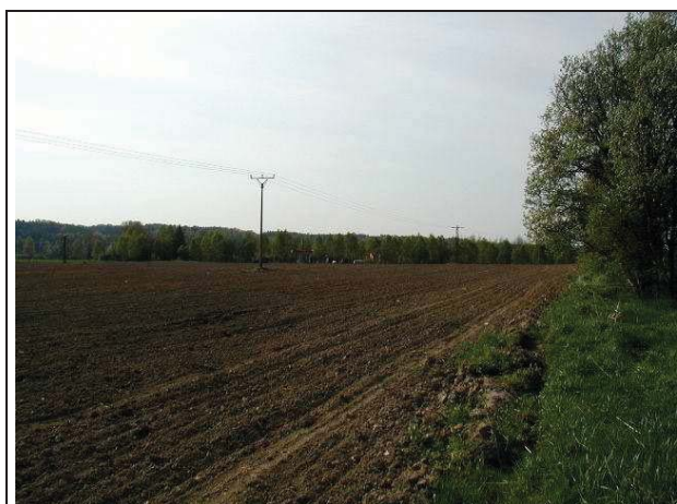
Foto č.....: Jablonné v Podještědí - celkové foto jihovýchodní část ložiska