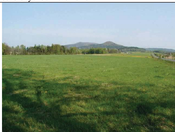
Foto č. ....: Jablonné v Podještědí - celkové foto severozápadní část ložiska