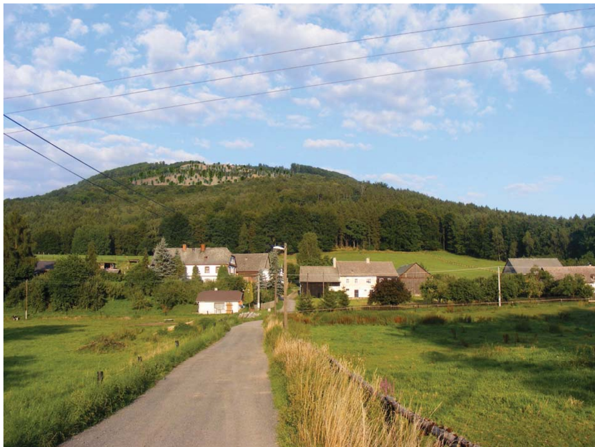
Návrh rekultivace po ukončení těžební činnosti v rámci POPD