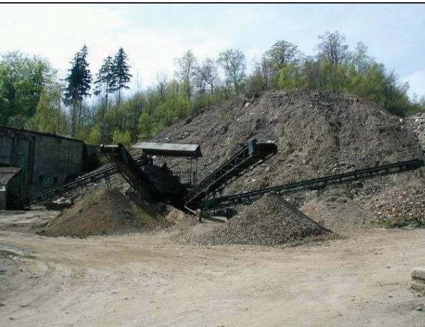
Foto č. 4: Lom Polevsko – skládka stavebních sutí ve vytěžené části lomu s linkou na úpravu sutí