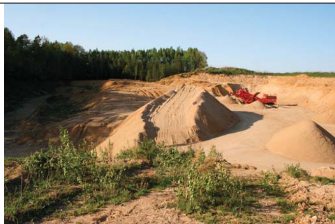
Foto č. 4.: Deponie suroviny a třídící zařízení