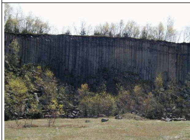
Foto č.....: Prysk – sloupcovitá odlučnost horniny, délka sloupců cca 8 m