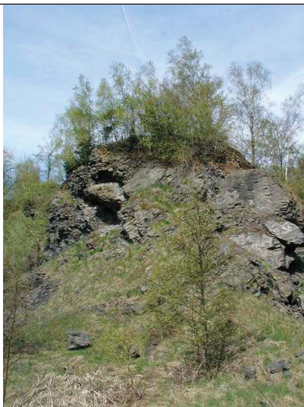
Foto č. 2: Lom Polevsko severozápadní část lomu se zbytky čedičové horniny