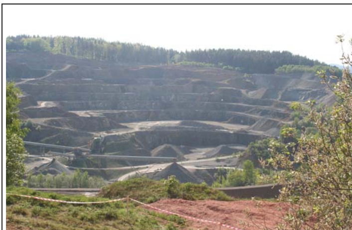
Foto č. 1: Celkový pohled na činný lom