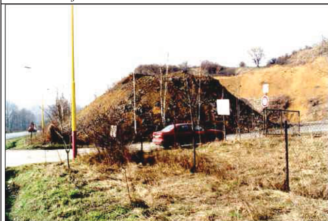
Foto č. 3: Pohled na jižní okraj ložiska a ochrannou kulisu, resp. vjezd do lomu