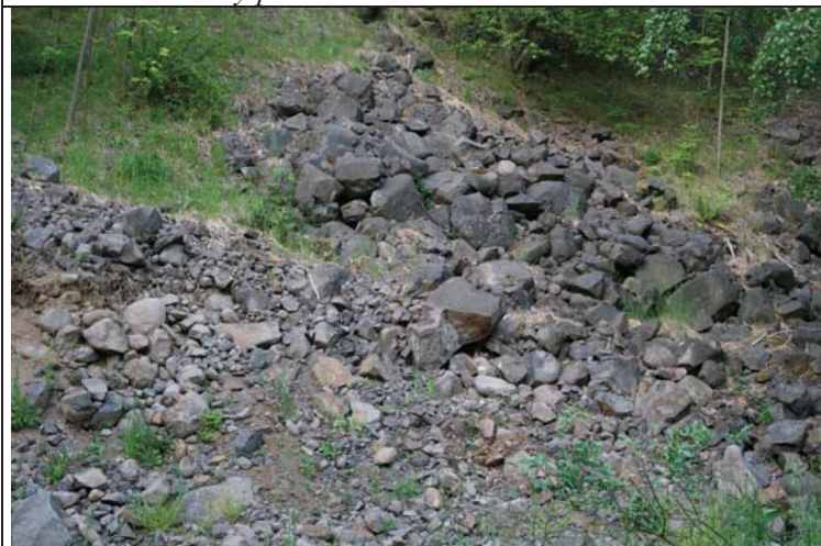
Foto č. 3: Závěrný svah a spodní etáž - na typický balvanitý materiál