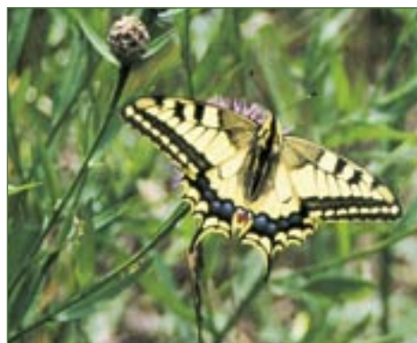
Otakárek fenyklový ( Papilio machaon ).

naženém čediči se vyskytují teplomilné druhy, např. skalník celokrajný ( Cotoneaster integerrimus ), trýzel škardolistý ( Erysium crepidifolium ) či strdivka sedmihradská ( Melica transsilvanica ). Do poloviny 20. století na skalních ostrozích hnízdil sokol stěhovavý ( Falco peregrinus ), dnes se zde vyskytuje jen poštolka obecná ( Falco tinnunculus ) a některé druhy netopýrů, netopýr velký ( Myotis myotis ) a netopýr řasnatý ( Myotis nattereri ). Ze zvláště chráněných druhů hmyzu je zde k vidění otakárek fenyklový ( Papilio machaon ).