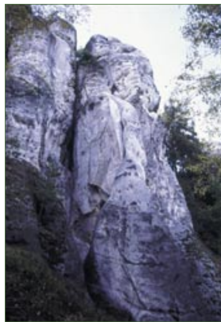
Skalní město Apolena.

Apolena je nevelké skalní město východně od obce Troskovice. Skály jsou tvořeny nepřilíživě zpevněným, mechanicky velmi málo odolným