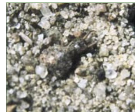
Larva mravkolva běžného ( Myrmeleon formicarius ).

pískovcem, což dosvědčují i samovolně se řítící skalní bloky a věže. Zatímco květena zachovalých reliktních borů a kyselých bučin je druhově chudá, ve skalách hnízdí typicky skalní druhy ptáků – poštolka obecná ( Falco tinnunculus ), výr velký ( Bubo bubo ), kavka obecná ( Corvus monedula ) a další. Ve skalním městě se nachází puklinová jeskyně Sklepy, největší svého druhu v Českém ráji. V jejích útrobách zimuje jedenáct druhů netopýrů, mezi nimi i vrápenec malý ( Rhinolophus hipposideros ) nebo netopýr černý ( Barbastella barbastellus ).