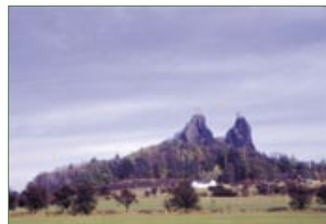
Trosky od jihu.

Ve 2. polovině 20. století docházelo vlivem zvyšujícího se používání chemických prostředků v zemědělství k postupnému snižování početnosti a druhové rozmanitosti zástupců hmyzu. Po zákazu plošné aplikace DDT v roce 1976 a celkovém zlepšení přístupu člověka k životnímu prostředí koncem 20. století se početnost hmyzí fauny v naší přírodě opět zvyšuje. Běžněji se v naší přírodě lze setkat s půvabným otakárkem fenyklovým ( Papilio machaon ).