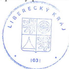
Martin Půta h e j t m a n

na základě § 7 odst. 2 písm. a) ve spojení s § 36 odst. 4 zákona č. 183/2006 Sb., o územním plánování a stavebním řádu, ve znění pozdějších předpisů, Aktualizaci č. 2 Zásad územního rozvoje Libereckého kraje, zpracovanou dle usnesení zastupitelstva kraje č. 165/22/ZK ze dne 26. 4. 2022, formou opatření obecné povahy podle zákona č. 500/2004 Sb., správní řád, ve znění pozdějších předpisů.