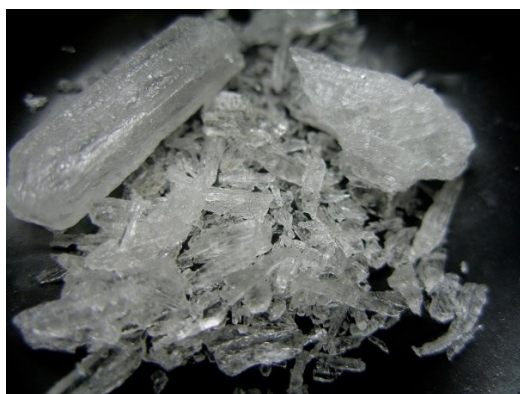
Obrázek č.1 a 2: krystaly a vzorec C10H15N