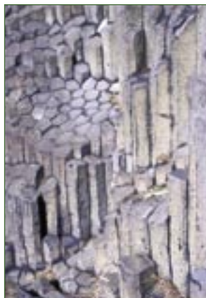
Sloupcová odlučnost čediče.

U třetihorních vyvřelin (čedičů, znělců a dalších) se objevuje tzv. sloupcová odlučnost. Sloupce vznikají při chladnutí a tuhnutí horkého magmatu a většinou mají tvar pěti až šestiúhelníku, pouze zřídka mají větší či menší množství stěn. V Libereckém kraji není Panská skála ojedinělým příkladem sloupcové odlučnosti, najdeme ji i v dalších chráněných územích (např. Pustý zámek, Čertova zeď, Kodešova skála, Stříbrník a další).