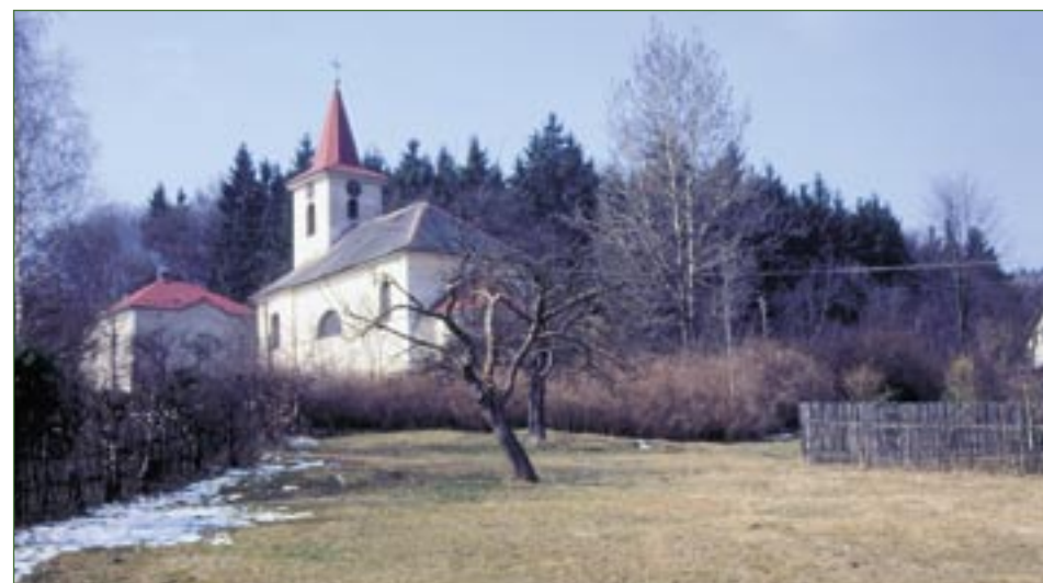
PP Farská louka.

Spravuje Správa CHKO České středohoří, tel.: 416 574 611