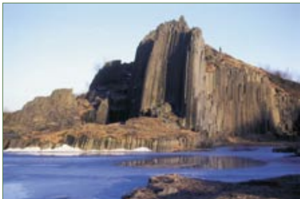
NPP Panská skála

Panská skála byla vyhlášena národní přírodní památkou pro ochranu unikátního čedičového suku s typickou sloupcovou odlučností. Tzv. kamenné varhany byly obnaženy těžbou sloupcového čediče v 19. a 20. století. Pozůstatkem těžby je i jezírko na úpatí přírodní památky.